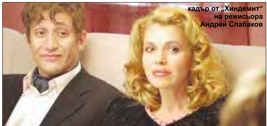
кадър от „Хиндеммит“ на режисьора Андрей Слабаков

Сравнително наситената програма и липсата на изненади във фаворитите на журито направи фестивалните дни спокойни и приятни. „Хиндеммит“ (реж. Андрей Слабаков) бе най-разгорещено коментиран, не само като българска премиера, но и като интересен обект на филмовия разказ, тематика,