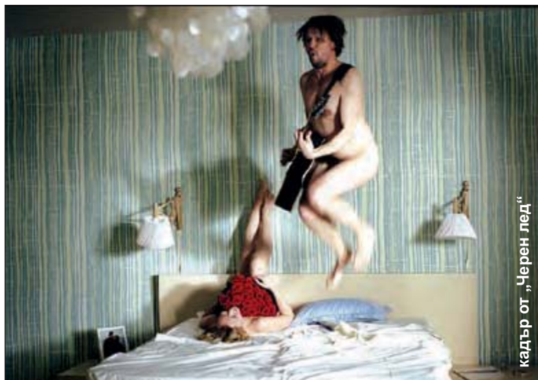
кадрът от „Черен лед“

на за „Златна мечка“ в Берлин. Продуцентът на филма Карле