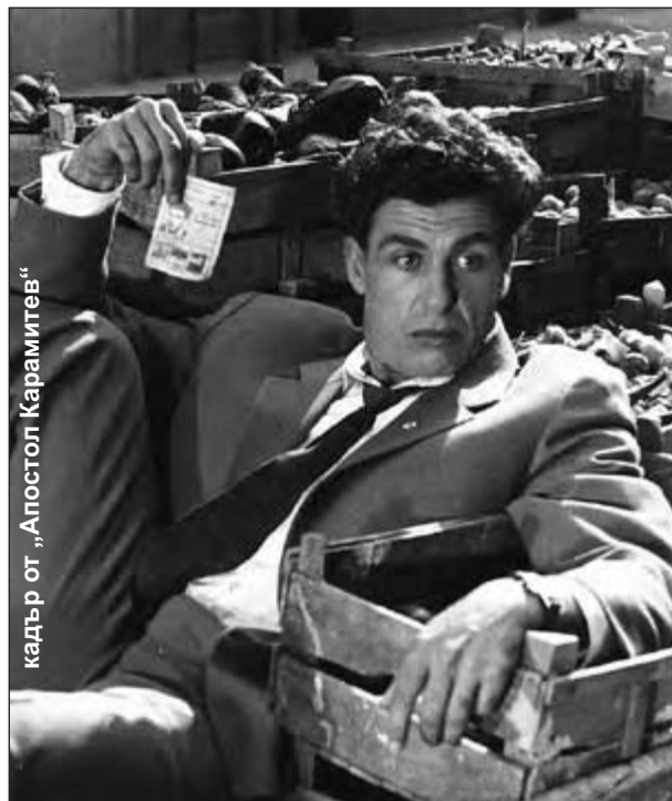
кадрът от „Апостол Карамитев“