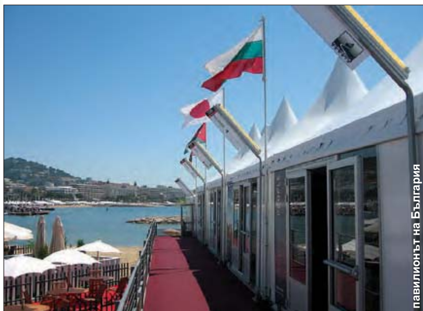
павилионът на България

Програма МЕДИА имаше своето видимо присъствие и във