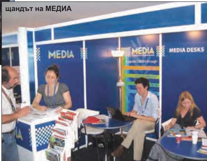
щандът на МЕДИА

денят от Националния филмов център каталог „Български филми 2007–2009“ и много други брошури и информационни материали, свързани с филмовата ситуация в страната, фестивалите, възможностите за копродукции и т. н.