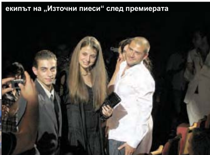
екипът на „Източни пиеси“ след премиерата

денят от Националния филмов център каталог „Български филми 2007–2009“ и много други брошури и информационни материали, свързани с филмовата ситуация в страната, фестивалите, възможностите за копродукции и т. н.