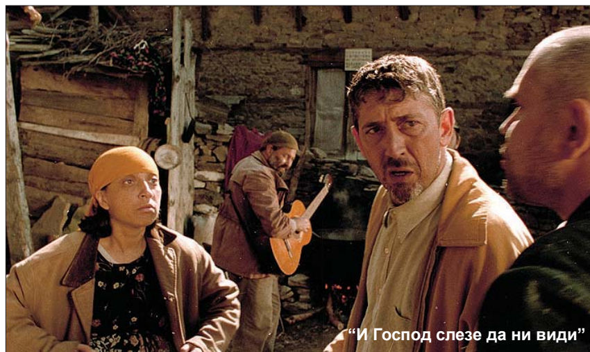
“И Господ слезе да ни види”

прочетена трудна страница от националното ни минало