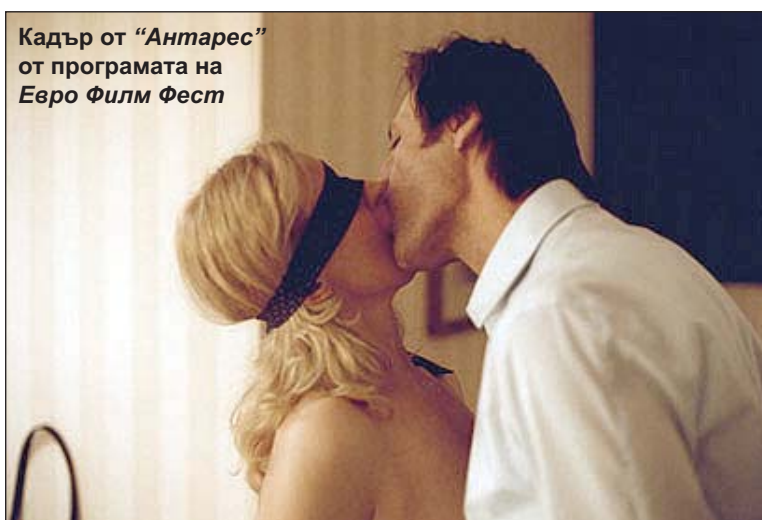
Кадър от "Антарес" от програмата на Евро Филм Фест

Основен организатор и инициатор на ЕВРО ФИЛМ ФЕСТ е