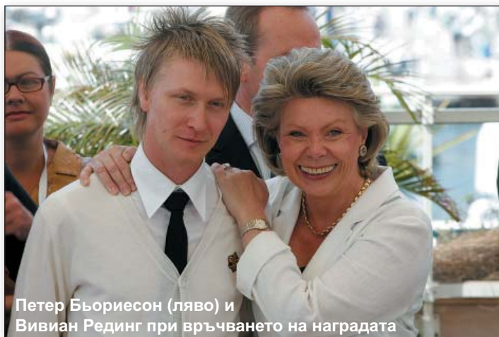
Петер Бьориесон (ляво) и Вивиан Рединг при връчването на наградата

Тази награда, учредена през 2004 година за най-добър сценарий, написан от европейски автор до 35 година, който е преминал тренингова програма, подкрепена от МЕДИА, беше връчена от г-жа Вивиан Рединг, европейски комисар по въпросите на информационното общество и медиите, в присъствието на културните министри на страните членки на Европейския съюз.